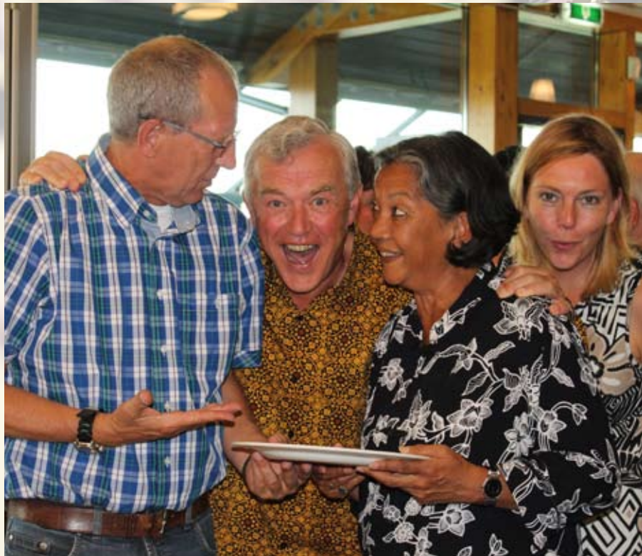
Deelnemers Ajoen ajoen 2013