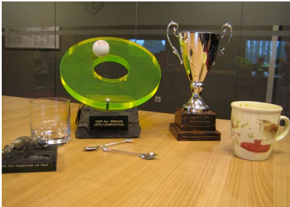
Trofeeën van "Fun" wedstrijden en "Q" wedstrijden van de Damesdag

Daarvoor zijn er nu, meer dan vroeger, goede handvatten in het 9 Stappen Plan van de NGF. Stap 4, 'op naar hcp. 28', stap 5 'op naar hcp. 20', stap 6 'op naar hcp. 15'. Dit zijn stappen uit het plan die de meeste golfers kunnen gebruiken. De strekking van deze stappen is mijns inziens verdieping van dat wat je in stap