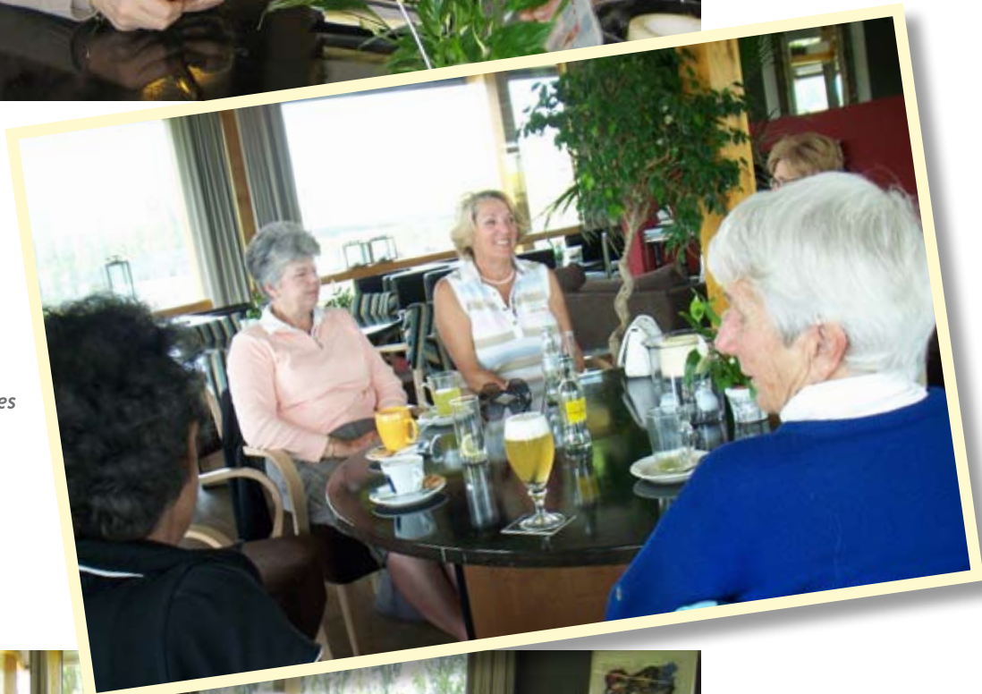
Na afloop, dames op hole 19