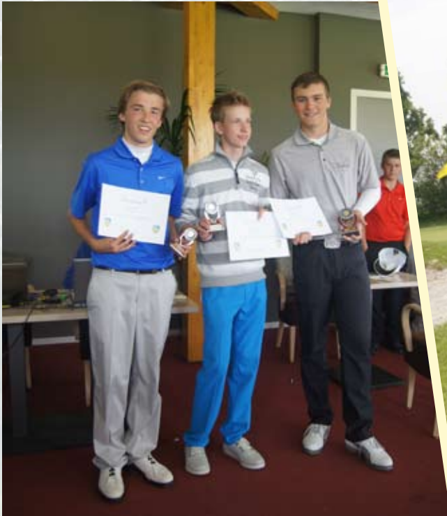
Winnaars categorie 6, 14 tm 18 jaar