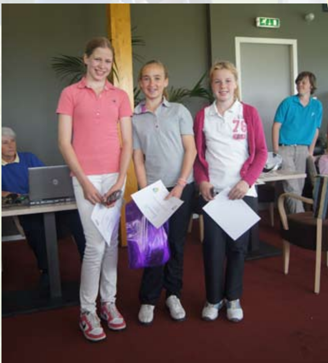
Winnaars categorie 5, meisjes 12 en 13 jaar