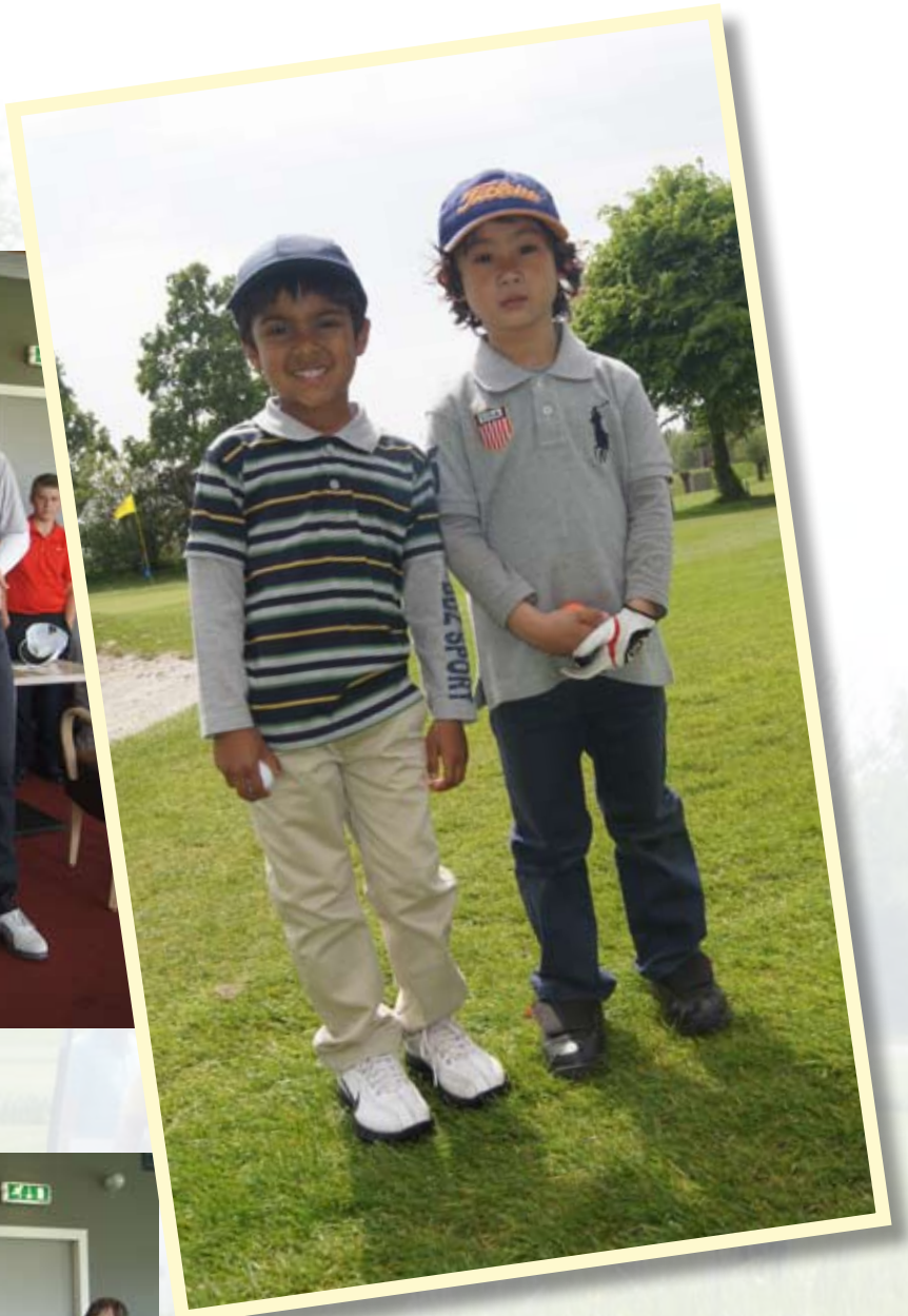
Jongste deelnemers: 5 jaar