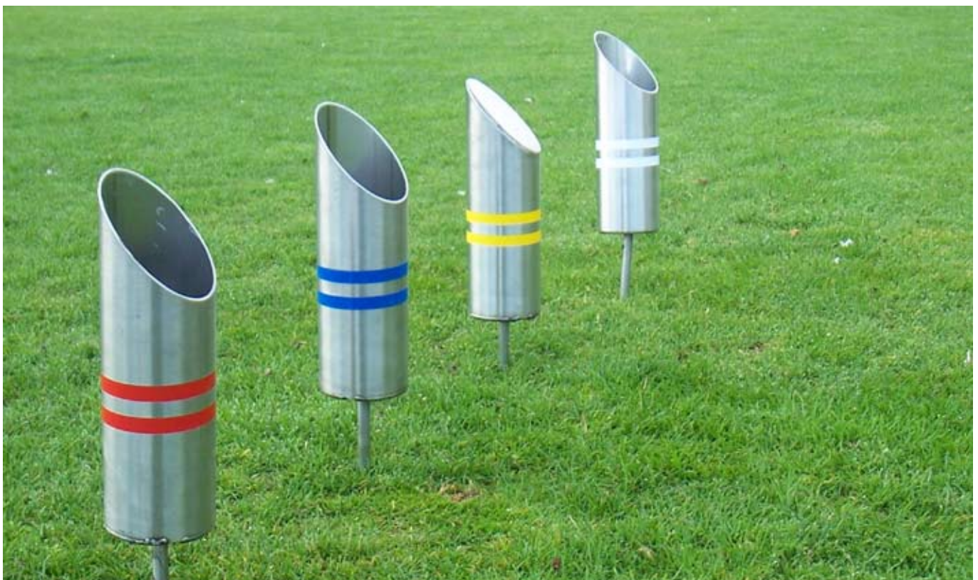
Wat nieuw is, is dat op de Teebox de kleur-afslag uitgangspunt is, en dat de 'Dames' en 'Heren'-afslag vervallen is.

Voor een foto impressie zie pagina 6-7 >