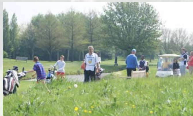
Bij tee 1: spelers, begeleiders en ouders

Per 2 categorieën was er een prijsuitreiking. Voor de 1e 3 was er een beker en een cadeaubon van de Kindergolfshop. Natuurlijk zijn ook de sponsors bedankt en hebben alle winnaars met uitzondering van de jongste gespeecht. Om ca 18.45 was de laatste prijsuitreiking afgelopen en gingen alle kinderen weer naar huis of aten nog een hapje op de club.