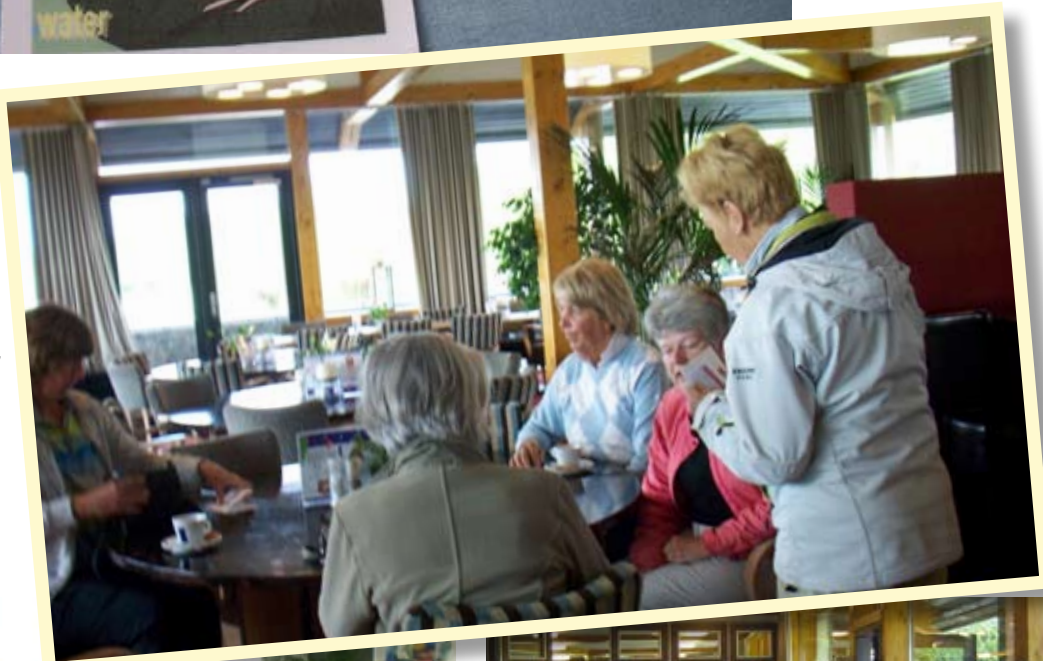
Dames zijn klaar voor de wedstrijd

Men krijgt zo'n kaart als je in de Bunker, Water, Out of Bounds komt of een 3 Put maakt. Maar je kunt de kaart doorgeven aan een ander die NA jou in zo'n hindernis komt! Elke kaart die een deelnemster na afloop van de wedstrijd in haar bezit heeft telt voor 3 strafslagen bij de eindscore.