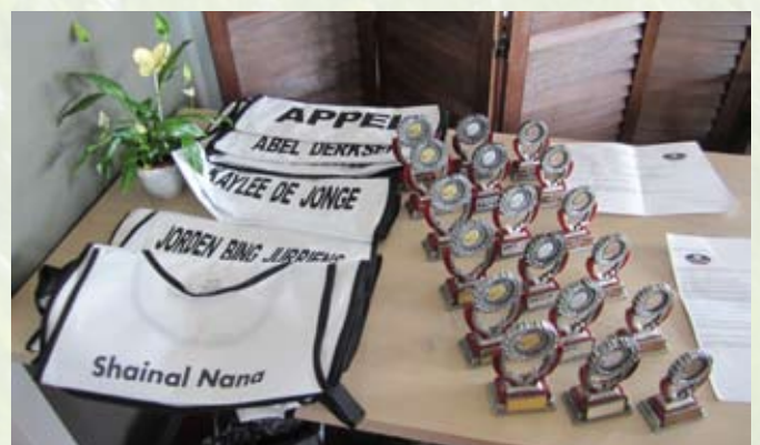
Prijzen en caddiehesjes