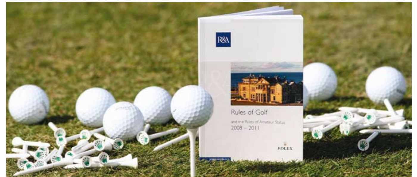
Dit oude boekje kan binnenkort vervangen worden door het nieuwe boekje: RULES OF GOLF 2012 - 2015

Daar is later een noot aan toegevoegd die je toestond binnen 5 minuten van de originele starttijd alsnog te starten, maar dan met 2 strafslagen in strokeplay of verlies van de eerste hole in matchplay. Die noot moest dan wel zijn opgenomen in het wedstrijdreglement. In