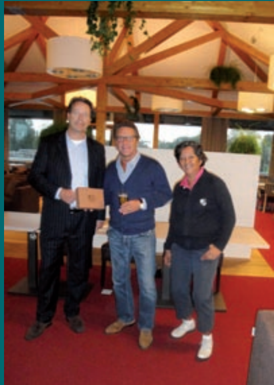
Winnaar BC Regenboogwedstrijd