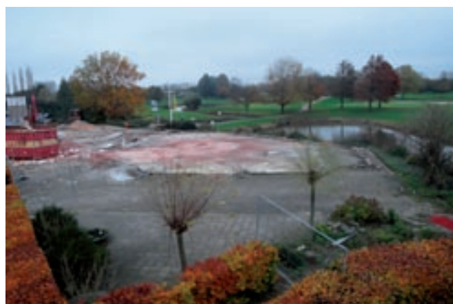
En straks genieten van het mooie uitzicht..