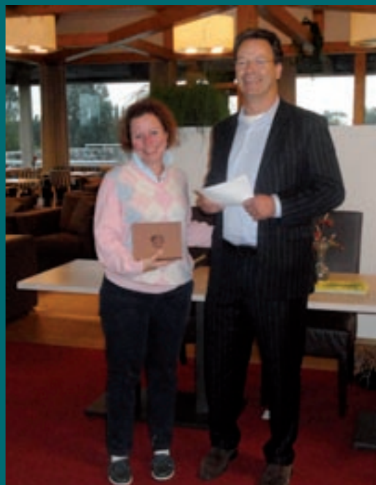
Winnares BC Regenboogwedstrijd