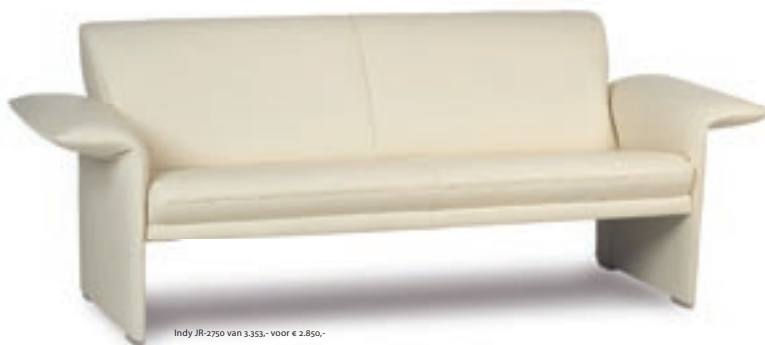
Indy JR-2750 van 3.353,- voor € 2.850,-