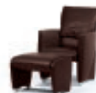
Corbo Zetel JR-3250 van 2.140,- voor € 1.819,- Corbo Poef JR-3250 van 1.040,- voor € 884,-