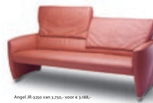
Angel JR-3250 van 3.750,- voor € 3.188,-

Actieprijs gelden voor alle kleuren, zelfs leder.