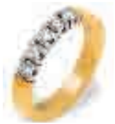
Alliance Ring 803 5 x 0,10 ct = 0,50 ct normaal € 1471,-