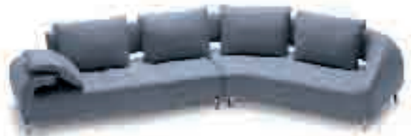
Vol de Rève