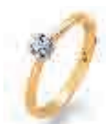
Solitaire ring Princess 25 Princess 0,15 ct normaal € 705,-