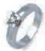
Ring d'Elite 22 0,25 ct normaal € 1445,-